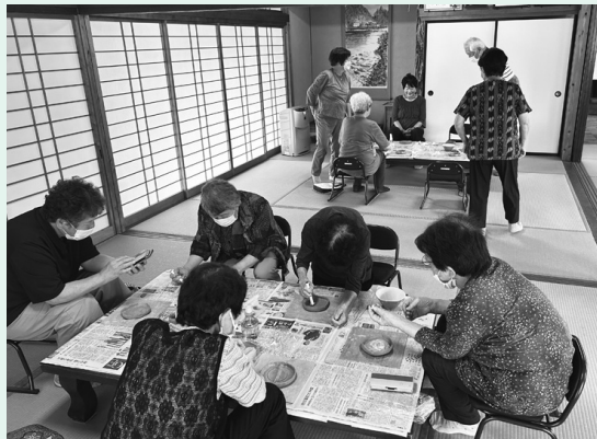
ミニデイサービスの様子

まっています。未実施地区も高齢者による組織を作っていただければ、補助の対象となりますので、ご相談ください。