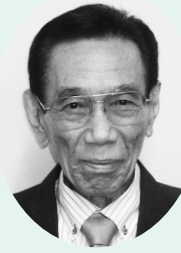
社会福祉法人 安来市社会福祉協議会